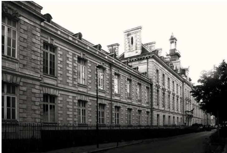
Mon cher lycée Clémenceau...

Lycéens nous étions, alors rappelons-nous des séries arithmétiques versus les séries géométriques... Pas toujours bien compris la pertinence ? Eh bien nous en sommes à pouvoir concrètement méditer à leur propos !