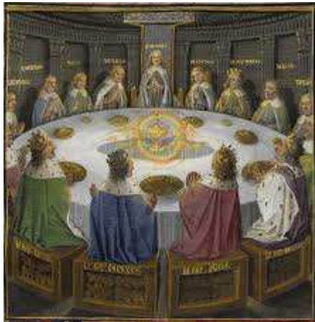
Table ronde qui faisait le tour du monde...

Ce soir- là, même l'Asie était ici, ancien et nouveau testaments, musulmans réunis !